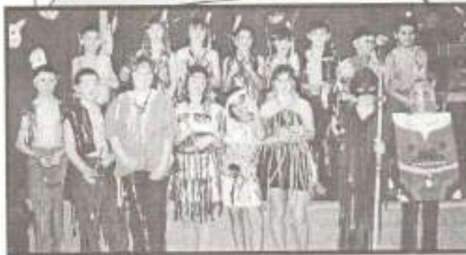
Indiánok, 4. osztály

„Tanuljatok, mintha örökké élnétek és úgy éljétek, mintha holnap meg kellene halnotok.” Szevillai Sz. Izidor