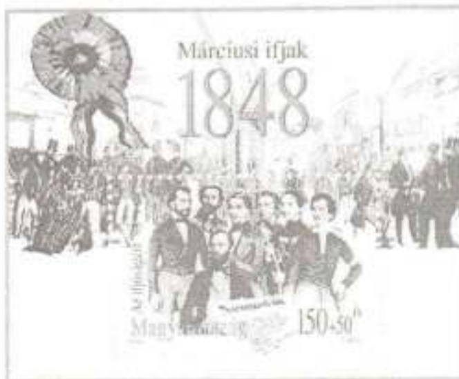
1848-as emlékbélyeg

„A gyermek a megtestesült öröm közöttünk.” Victor Hugo