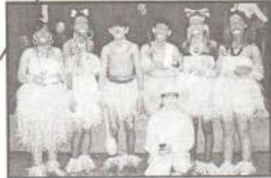
Kannibálok és a pórnál járt fehér ember, 6. osztály

A Nógrád Megyei Hírlap felhívására érdekes versenyen vettünk részt. Hóból kellett építeni. Mi egy maradandó épület – a Visegrádi vár –, nem maradandó mását készítettük el.