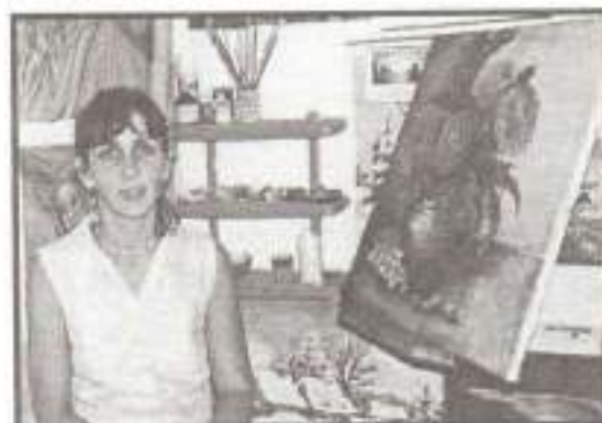
Szöveg és fotó: Bárány Bernadett

Ida - mint megtudtam tőle - saját műtermében festi képeit, ahol szintén nagyon szép képek láthatók. Emléktul leucsevégre kaptam szeretett műtermében, alkotásai körében. Jelenleg egy csendéleten dolgozik, a fotón ezzel került megörökítésre. Elbűsürvén sok sikert kívántam további munkáihoz, valamint azt, hogy művei által tovább öregbítse községünk jó hírnevét.