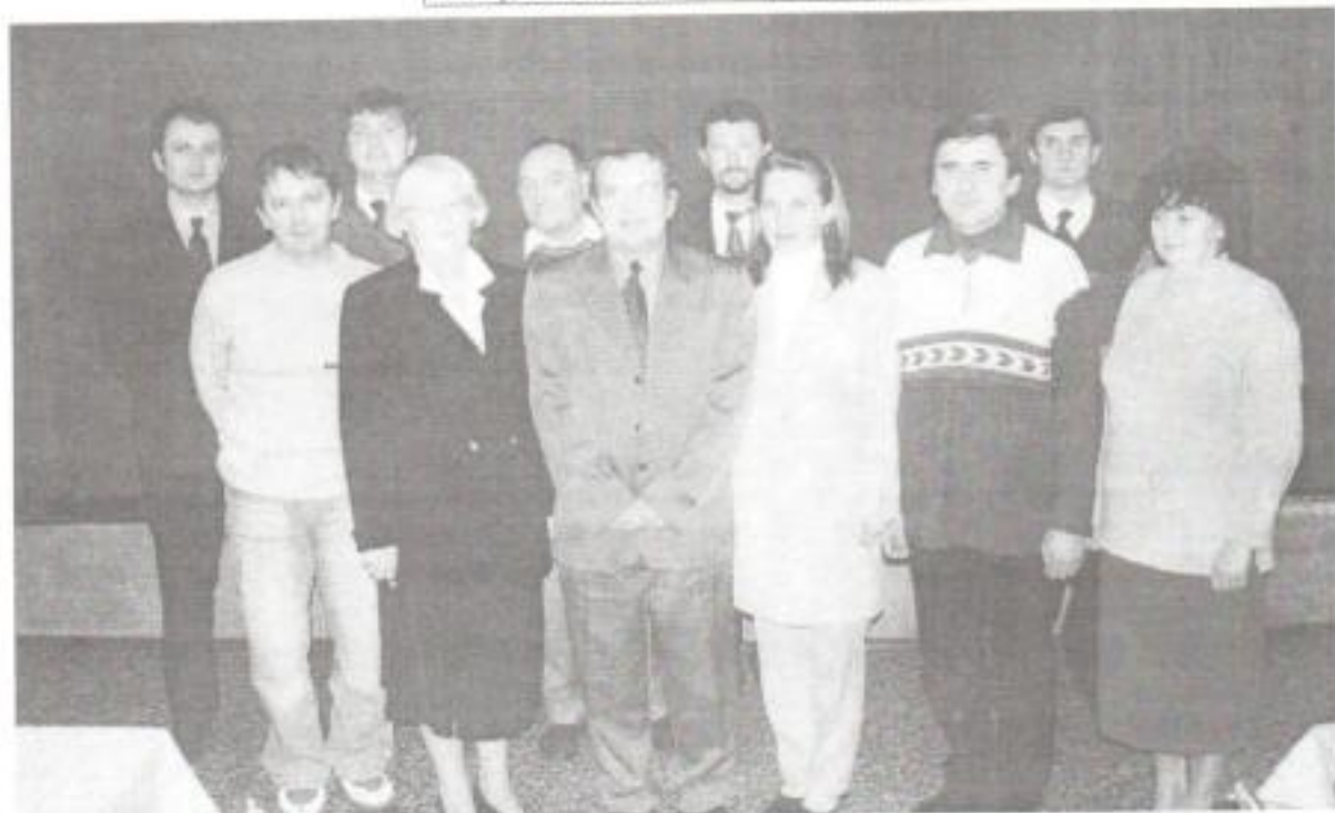
Varsány Község Önkormányzat új Képviselő testülete