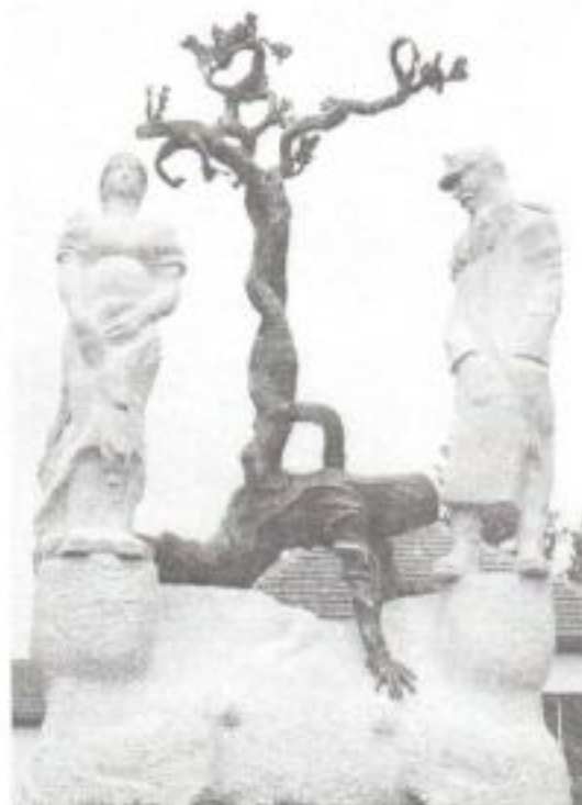
Fotó és szöveg: Bárány Bernadett

Az emlékmű megvalósulását a Varsány Fejlesztéséért Közalapítvány és a Nemzeti Kulturális Örökség Minisztériuma támogatása tette lehetővé.